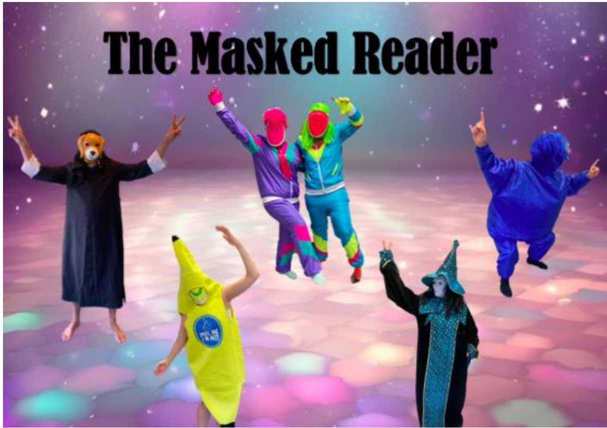
De figuren van 'The Masked Reader 2024': 'Nond', 'Banaan', 'Fluo Duo', 'Tita Tovenaar' en 'Bolleke Blauw'. Ze kwamen allemaal op bezoek bij onze leerlingen!